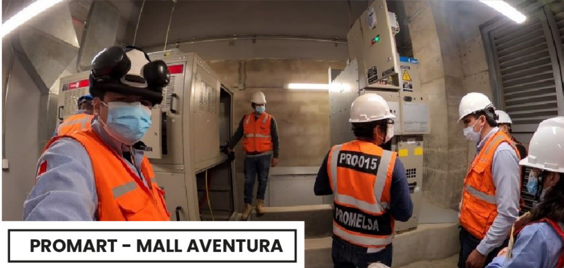
PROMART - MALL AVENTURA